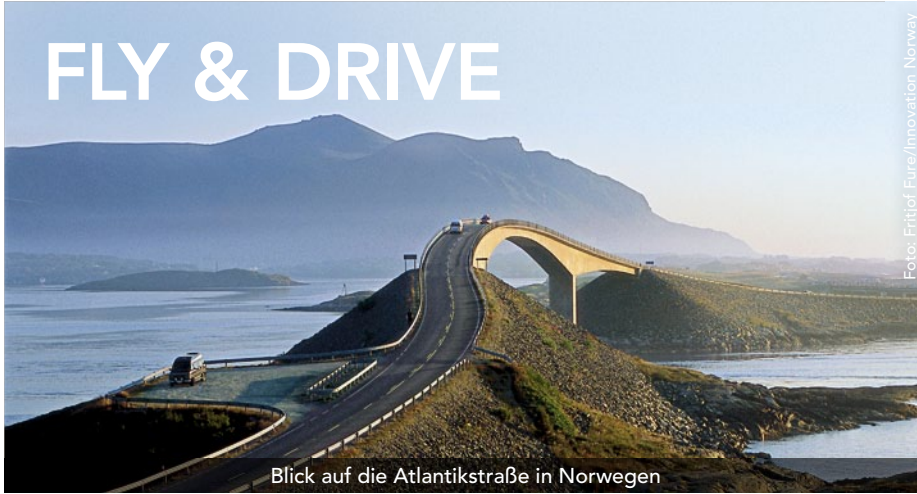
Blick auf die Atlantikstraße in Norwegen