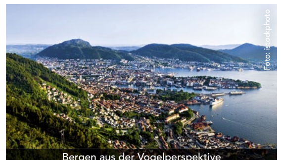
Bergen aus der Vogelperspektive