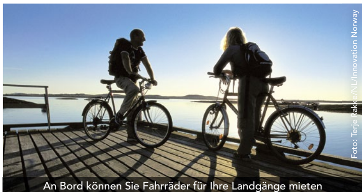
An Bord können Sie Fahrräder für Ihre Landgänge mieten