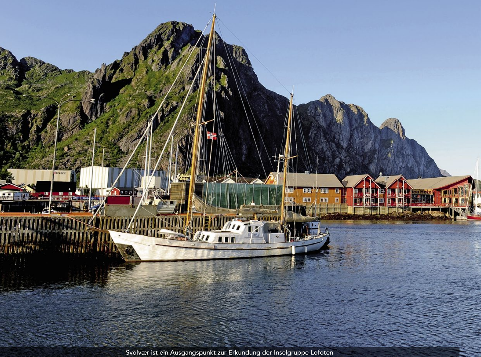
Svolvær ist ein Ausgangspunkt zur Erkundung der Inselgruppe Lofoten