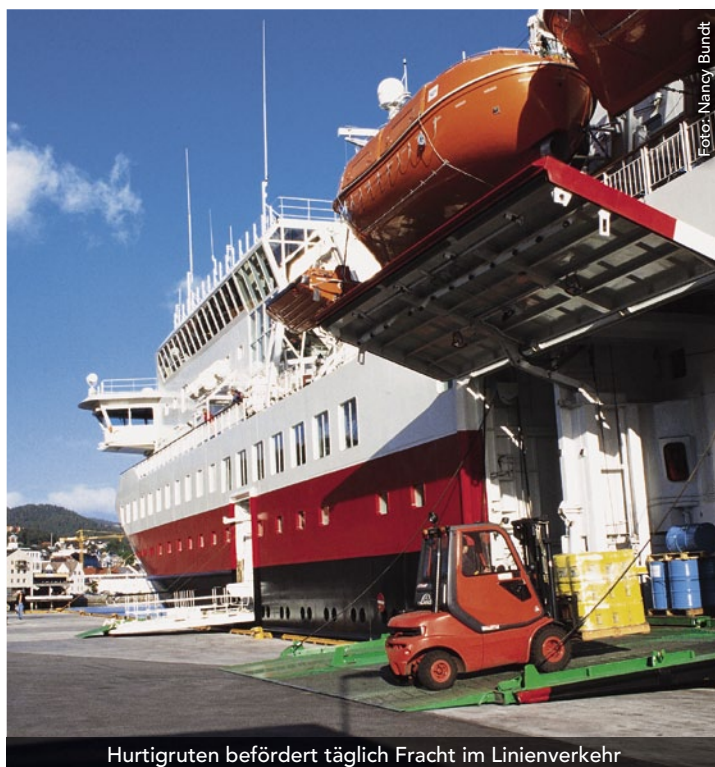
Hurtigruten befördert täglich Fracht im Linienverkehr